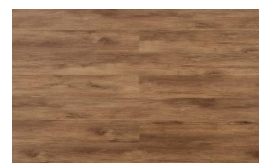
202 - KBW 8511 - Bruges